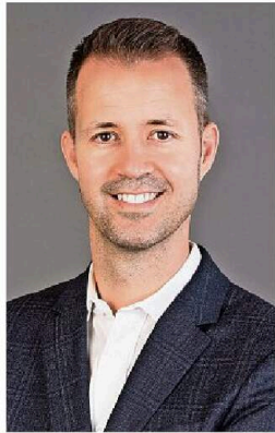
«Mit den Zöllen können die Firmen umgehen. Eine Rezession wäre schwieriger.»

Schauen die Anleger wieder vermehrt auf die Bewertungskennzahlen?